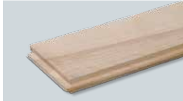
フローリングボード