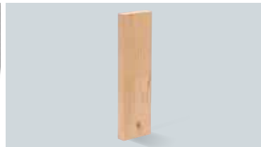
枠組壁工法構造用たて継ぎ材