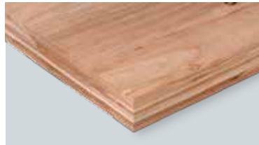
造作用単板積層材