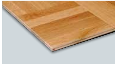
モザイクパーケット