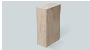
構造用単板積層材