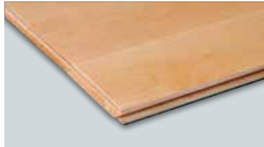
フローリングブロック