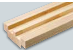
化粧ばり造作用集成材