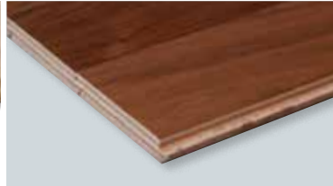
複合フローリング