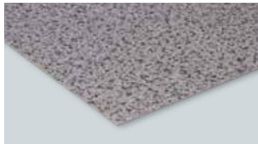
特殊加工化粧合板